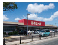
ルミエール志免店 (約230m・徒歩3分)