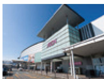
イオンモール福岡 (約1,000m・徒歩13分・車2分)