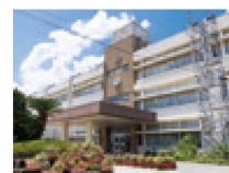
町立志免中央小学校 (約320m・徒歩4分)

※建物写真は令和7年3月撮影、環境写真は令和5年7・8月撮影。 ※表示の距離は地図上の概測距離です。徒歩分数は1分=80m、車での所要時間は時速30kmで換算しています(端数切上げ)。