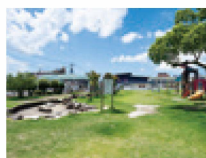
中の坪公園(メインパーク) (約220m・徒歩3分)